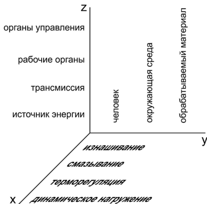
Рис. 1. – Процессы в ТС