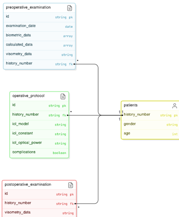
Рис. 1. – Объектная модель представления данных используемых научных СЭМД первого, второго и третьего типов

недоступно в офтальмологии, особенно при рассмотрении данных от различных приборов. Модели классического машинного обучения обеспечивают достаточно высокий уровень точности при относительно небольших объемах данных, что делает их более применимыми в сценариях с ограниченным доступом к медицинским данным.