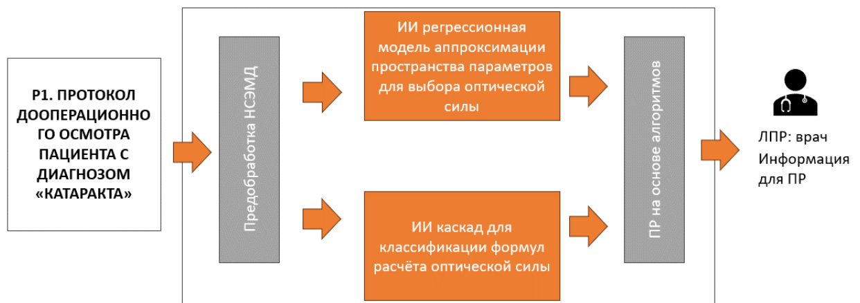
Рис. 3. – Новая схема поддержки принятия решения врача о выборе формулы

Система научного регистра электронных медицинских документов (НРЭМД) обеспечит эффективное сохранение структурированных медицинских данных, включая результаты глазометрии, диагнозы, хирургические вмешательства и послеоперационные показатели.