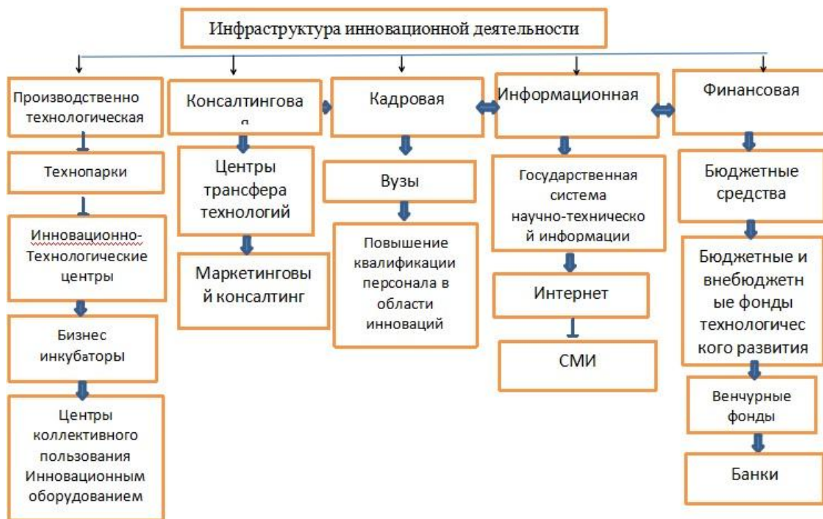
Рис. 1 - Инфраструктура инновационной деятельности

рисунке 1 представлена схема инфраструктуры инновационной деятельности, необходимая для эффективного функционирования инновационного процесса в регионе.