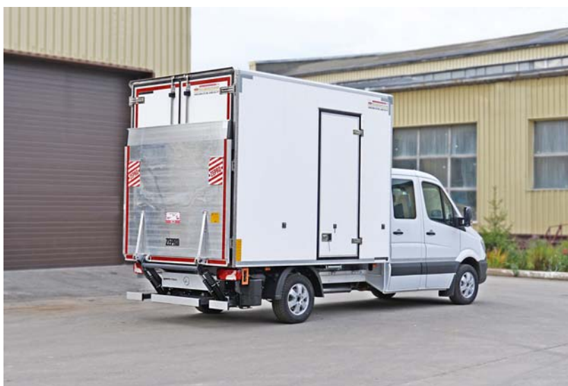
Рис. 1. – Общий вид изотермического фургона марки Mercedes

Предприятие ООО «Транспортник» располагается по адресу: ст. Казанская, ул. Транспортная 1. СТО состоит из общего массива обслуживающих и ремонтных участков. Предприятие осуществляет техническое обслуживание и ремонт легковых автомобилей и изотермических фургонов марки Mercedes (рис.1).