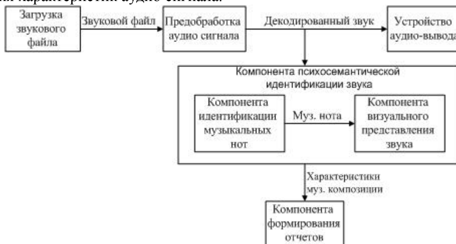
Рис. 1. Концептуальная схема разрабатываемой программной системы

Концептуальная схема представляет собой обобщенные функциональные и информационные компоненты проектируемого программного продукта, принципы их взаимодействия между собой, с пользователем и внешней средой [3]. По результатам вышеописанной работы была спроектирована концептуальная схема новой системы психосемантического анализа звука, которая показана на рис. 1, где показаны две концептуальные части – компонента обработки аудио данных поступивших в систему и компонента анализа идентифицированных психологических характеристик [4]. Качество идентификации данных повышается за счет использования компоненты математической обработки аудио данных, принцип действия которой основан на алгоритме прямого быстрого преобразования Фурье и оконной функции Хэмминга, которая повышает точность распознавания характеристик аудио сигнала.