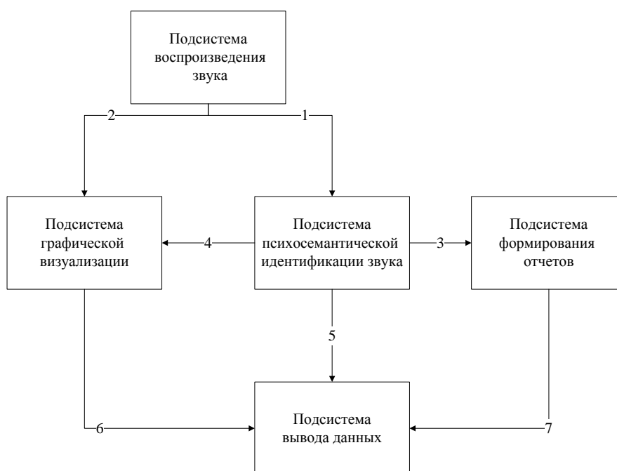
Рис. 2. Функциональная схема проектируемой системы.

На основании перечня приведенных функций, которые должна выполнять проектируемая система, была построена обобщенная функциональная структура, которая позволит определить состав входящих в нее подсистем и связь между ними: «Подсистема воспроизведения звука», «Подсистема графической визуализации», «Подсистема психосемантической идентификации звука», «Подсистема формирования отчетов», «Подсистема вывода данных» (Рис. 2).